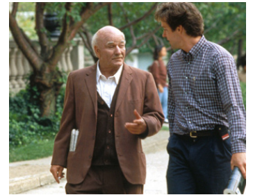
1995 UN MÉNAGE EXPLOSIF (Roommates) de Peter Yates avec D. B. Sweeney