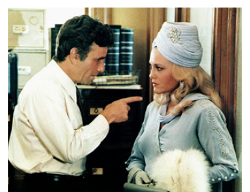
1978 LE PRIVÉ DE CES DAMES (The cheap Detective) de Robert Moore avec Madeline Kahn