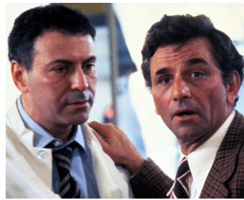
1979 NE TIREZ PAS SUR LE DENTISTE (The In-Laws) d'Arthur Hiller avec Alan Arkin