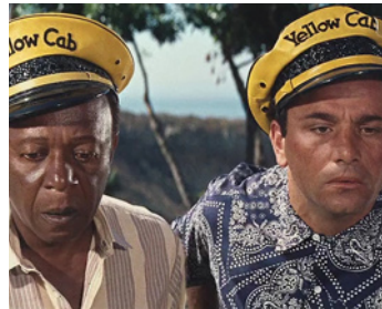
1963 UN MONDE FOU, FOU, FOU (It's a mad, mad, mad world) de S. Kramer avec Sid Caesar