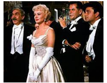
1961 MILLIARDAIRE POUR UN JOUR (Pocketful of Miracles) de F. Capra avec Hope Lange, G. Ford