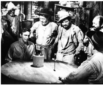
1958 LA FORÊT INTERDITE (Wind across the Everglades) de N. Ray avec C. Plummer, B. Ives