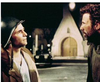
1969 UN CHÂTEAU EN ENFER (Castle Keep) de Sydney Pollack avec Bruce Dern