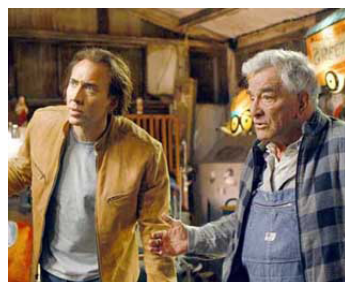
2007 NEXT (Next) de Lee Tamahori avec Nicolas Cage