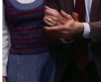
1977 OPENING NIGHT (Opening Night) de John Cassavetes avec Gena Rowlands