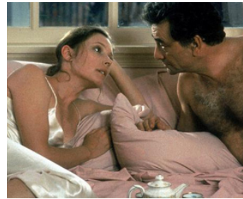
1987 BONNE ANNÉE (Happy New Year) de John G. Avildsen avec Wendy Hughes