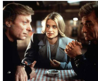
1993 SI LOIN, SI PROCHE (In weiter Ferne, so nah) de Wim Wenders avec Otto Sander, N. Kinski