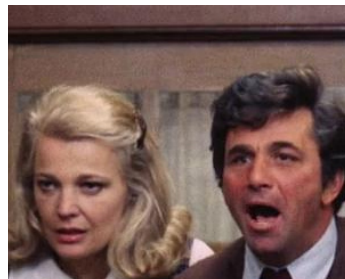
1974 UNE FEMME SOUS INFLUENCE (A Woman under the Influence) de J. Cassavetes avec Gena Rowlands