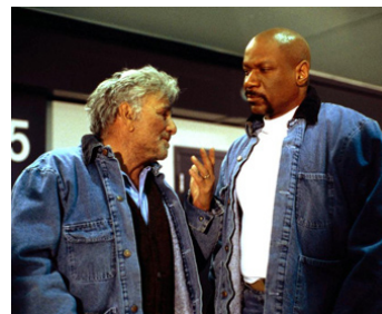
2002 UN SEUL DEVIENDRA INVINCIBLE (Undisputed) de Walter Hill avec Ving Rhames