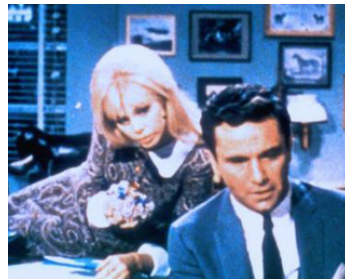
1966 TOO MANY THIEVES d'Abner Biberman avec Britt Ekland