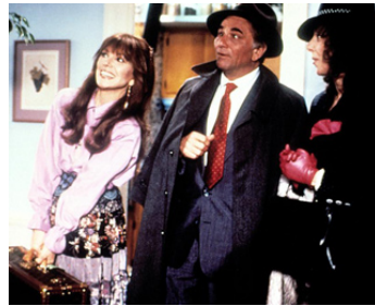
1990 2 FEMMES POUR UN TUEUR (In the Spirit) de Sandra Seacat avec Jeannie Berlin, Elaine May