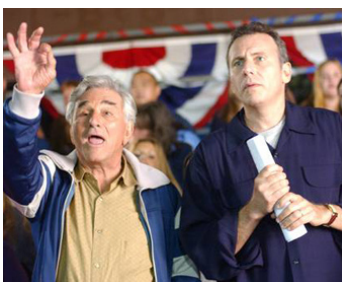
2005 THE THING ABOUT MY FOLKS de Raymond De Felitta avec Paul Reiser