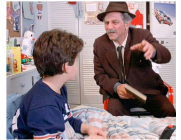
1987 PRINCESS BRIDE (The Princess Bride) de Rob Reiner avec Fred Savage