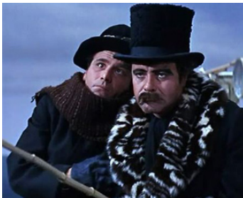
1965 LA GRANDE COURSE AUTOUR DU MONDE (The great Race) de B. Edwards avec J. Lemmon