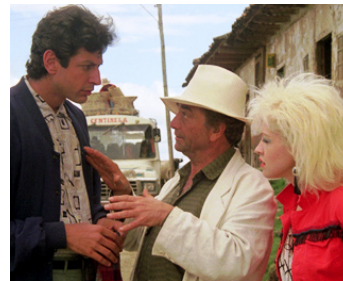
1988 ENQUÊTE EN TÊTE (Vibes) de Ken Kwapis avec Jeff Goldblum, Cindy Lauper