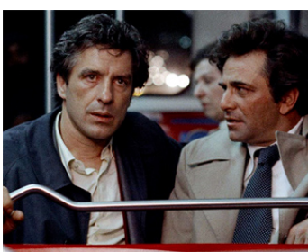
1976 MIKEY ET NICKY (Mikey and Nicky) d'Elaine May avec John Cassavetes