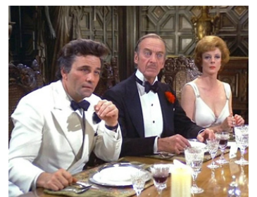
1976 UN CADAVRE AU DESSERT (Murder by Death) de Robert Moore avec David Niven, Maggie Smith