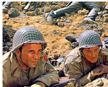
1968 LA BATAILLE POUR ANZIO (Anzio) d'E. Dmytryk & D. Coletti avec R. Mitchum