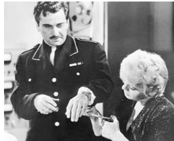
1963 LE BALCON (The Balcony) de Joseph Strick avec Shelley Winters