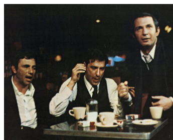
1970 LES MARIS (Husbands) de John Cassavetes avec John Cassavetes, Ben Gazzara