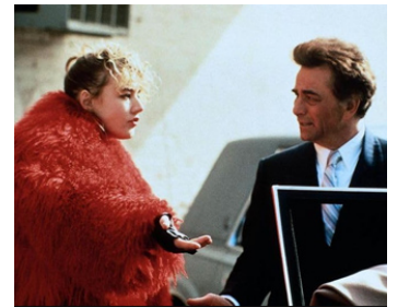
1989 COOKIE (Cookie) de Susan Seidelman avec Emilie Lloyd