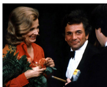
1977 OPENING NIGHT (Opening Night) de John Cassavetes avec Gena Rowlands