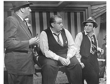
1964 LES 7 VOLEURS DE CHICAGO (Robin and the 7 Hoods) de G. Douglas avec Victor Buono