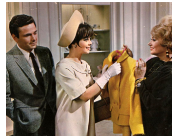
1966 LES PLAISIRS DE PÉNÉLOPE (Penelope) d'Arthur Hiller avec Natalie Wood, L. Kedrova