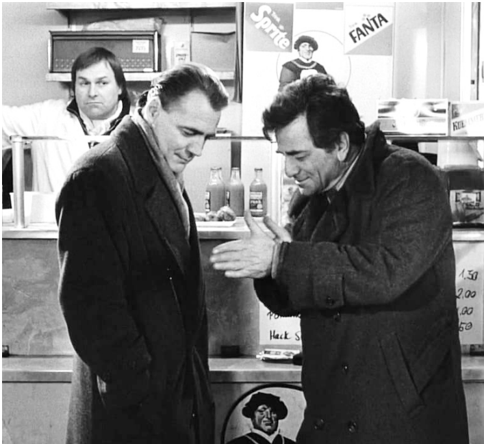
1987 LES AILES DU DÉSIR (Der Himmel über Berlin) de Wim Wenders avec Bruno Ganz