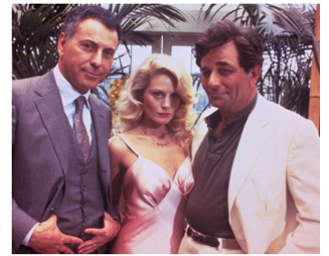
1986 BIG TROUBLE de John Cassavetes avec Alan Arkin, Beverly D'Angelo