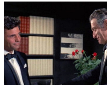
1968 LES INTOUCHABLES (Gli intoccabili) de Giuliano Montaldo avec Luigi Pistilli