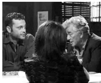
2001 LE MATCH (Made) de Jon Favreau avec Vince Vaughn, Famke Janssen