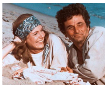
1976 LE SOURIRE AUX LARMES (Griffin and Phoenix) de Daryl Duke avec Jill Clayburgh