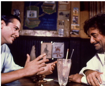
1990 TANTE JULIA ET LE SCRIBOULLARD (Tune in Tomorrow) de Jon Amiel avec Keanu Reeves