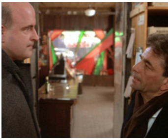
1978 TÊTES VIDES CHERCHENT COFFRES PLEINS (The Brink's Job) de W. Friedkin avec Peter Boyle