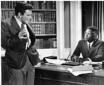
1962 PRESSURE POINT d'Hubert Cornfield avec Sidney Poitier